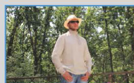
МАСТЕРСКАЯ «РУССКИЙ СТИЛЬ» (г. НОВОСИБИРСК, РОССИЯ)