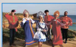
АССОЦИАЦИЯ «ЦЕНТР ИЗ ВОСТОЧНОЙ ЕВРОПЫ И ДРУЗЬЯ» (г. ПОРТИМАУ, ПОРТУГАЛЬСКАЯ РЕСПУБЛИКА)